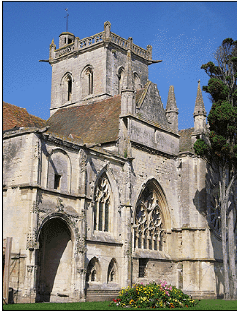
Dives-sur-mer - L'église de Dives-sur-mer

Dans cette église, sur une plaque commémorant le jour du départ vers l'Angleterre, on retrouve la liste complète des compagnons de Guillaume le Conquérant. Le 17 août 1862, au cours d'une séance académique internationale, eut lieu l'inauguration de la liste de ses compagnons.