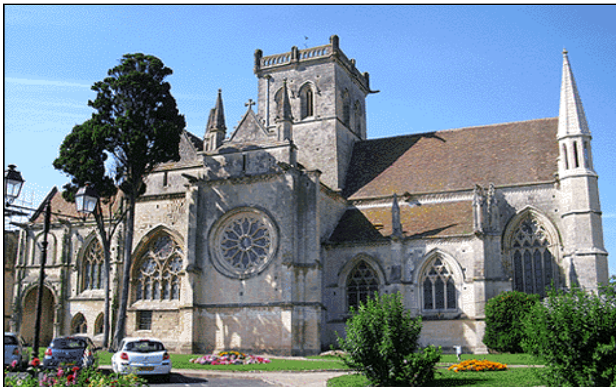
Dives-sur-mer - L'église de Dives-sur-mer [Photo prise en août 2007 par C. Deméautis]

L'origine de l'église de Dives-sur-mer remonte au début du XI ème siècle. « [...] l'an mil et un de la grâce de Dieu, le sixième jour d'août, les marinaux (pêcheurs) levèrent de la mer Saint-Sauveur en leur rays (ramenèrent dans leurs filets) l'image de notre Seigneur sans croix (un Christ sans croix) ».