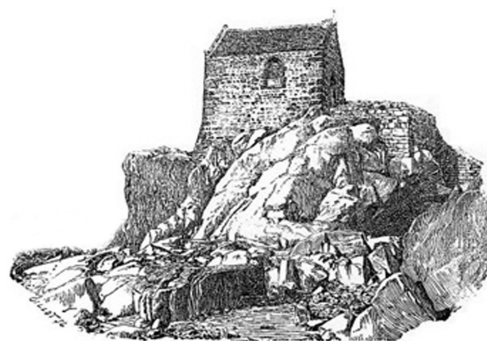
Chapelle Saint-Aubert - Le mont Saint-Michel

D'après la légende, celui-ci aurait eu une vision dans laquelle l'Archange Michel lui aurait ordonné d'édifier un oratoire sur l'île de marée rocheuse à l'embouchure de la rivière Couesnon.